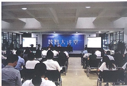
2018年5月26日，大数据统计学院第二期培训暨“新时代统计大讲堂”知识讲座在我校修德楼一楼数智大讲堂举行。

学院以服务社会为导向、以学科建设为引领、以科学研究为主体、以人才培养为核心，将坚持创新开放、引领发展，未来有望成为国内领先、系统配套、特色鲜明的大数据统计理论与实践的研究高地；坚持以人为本、多元发展，力争成为世界知名高素质大数据统计人才培养基地。